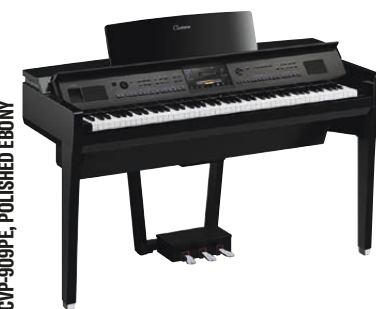
CVP-909PE, POLISHED EBONY