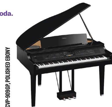
CVP-909GP, POLISHED EBONY

I punti nel testo in grassetto indicano le caratteristiche migliorate o aggiunte rispetto al CVP-905.