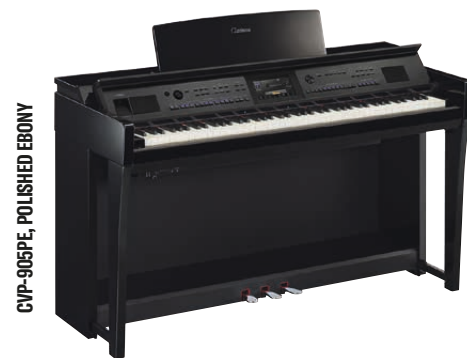
CVP-905PE, POLISHED EBONY